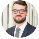
WOLF REUTER Staatssekretär a.D.