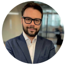
DIOGO COSTA Präsident der Foundation for Economic Education